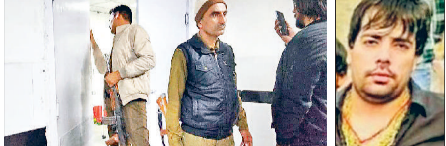
रोहतक। वारदात के बाद अलर्ट पर जेल कर्मचारी। (इनसेट में) घायल कैदी।

कैदियों में मारपीट से हड़कंप, एक गंभीर रूप से घायल