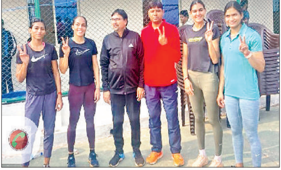
रोहतक। विजेता खिलाड़ी अपने कोच के साथ।