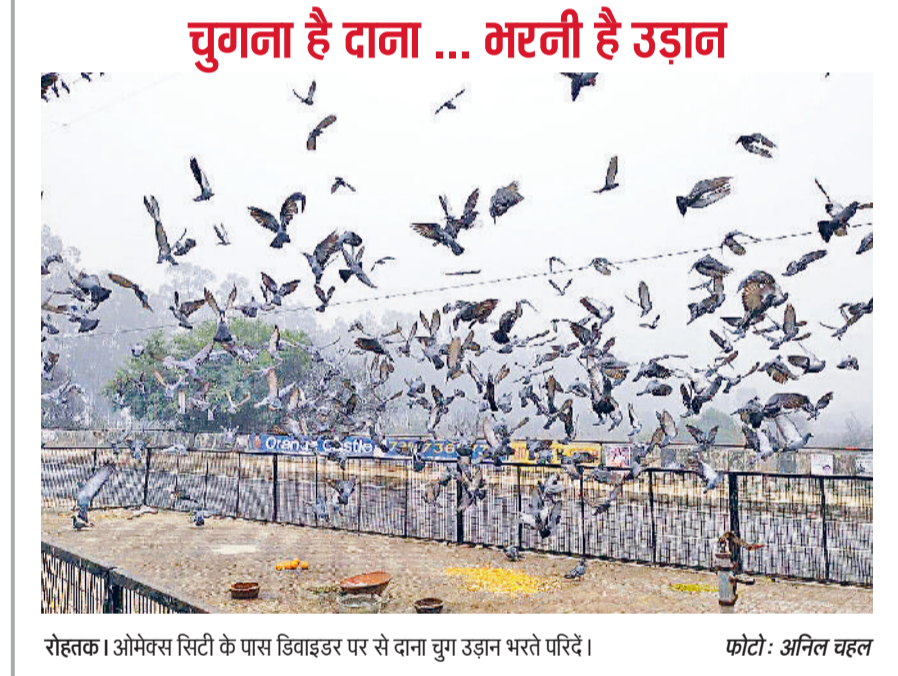
रोहतक। ओमेक्स सिटी के पास डिवाइडर पर से दाना चुग उड़ान भरते परिदे।