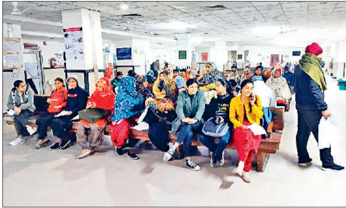
रोहतक। ओपीडी के बाहर बैच पर बैठे मरीज।

देर शाम तक पंचकुला में एचसीएमएस एसोसिएशन और स्वास्थ्य विभाग के उच्चाधिकारियों के बीच हुई बैठक के बाद आश्वासन दिया गया। इसके बाद डॉक्टरों ने शनिवार, रविवार और सोमवार तक हड़ताल को स्थगित कर दिया है। एचसीएमएस