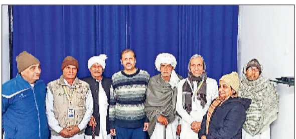
महम। मदीना में आरओ लगवाने की मांग को लेकर अधिकारियों से मिलने पहुंचे ग्रामीण।